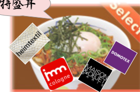
井 福家 TRENDon